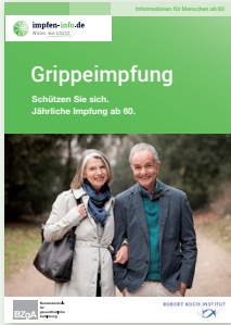
Broschüre Senioren (DIN A6) Erhältlich in Deutsch, Türkisch und Russisch!