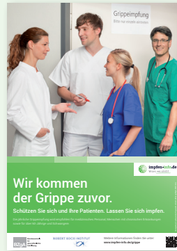
Plakat Medizinisches Personal (DIN A2 und DIN A3)