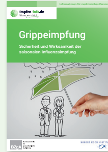
Broschüre Medizinisches Personal „Sicherheit und Wirksamkeit“ (DIN A6)