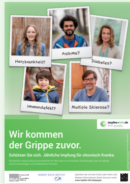
Plakat Chronisch Kranke (DIN A3)