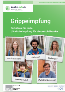
Broschüre Chronisch Kranke (DIN A6) Erhältlich in Deutsch, Türkisch und Russisch!