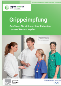
Broschüre Medizinisches Personal (DIN A6)