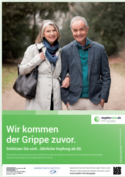
Plakat Senioren (DIN A2 und DIN A3)