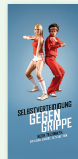
Falblatt „Selbstverteidigung gegen Grippe“ (DIN lang)