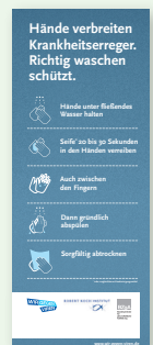
Aufkleber „Richtig Hände waschen“ (Größe 30 x 12 cm)