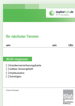
Terminblock (Terminvereinbarungszettel, 7x10cm)