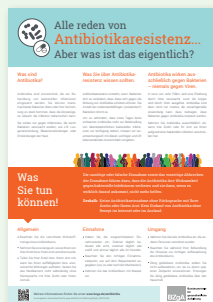
Plakat Antibiotikaresistenz (DIN A2 und DIN A3), Auch als PDF-Download unter www.bzga.de/antibiotika