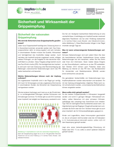
Factsheet „Sicherheit und Wirksamkeit der Grippeimpfung“, PDF-Download unter www.impfen-info.de/grippe