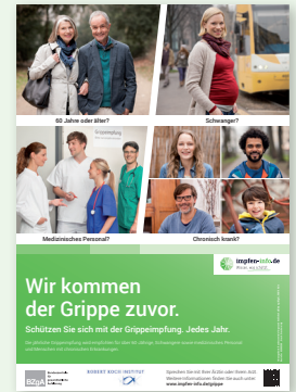
Plakat Allgemeines Kampagnenmotiv (DIN A2 und DIN A3)