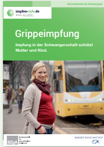
Broschüre Schwangere (DIN A6) Erhältlich in Deutsch, Türkisch, Russisch und Englisch!