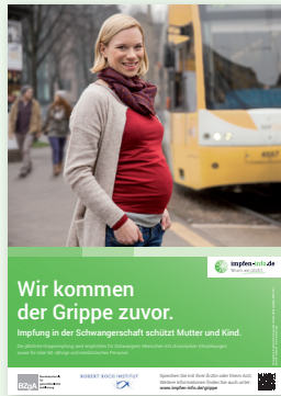
Plakat Schwangere (DIN A3)